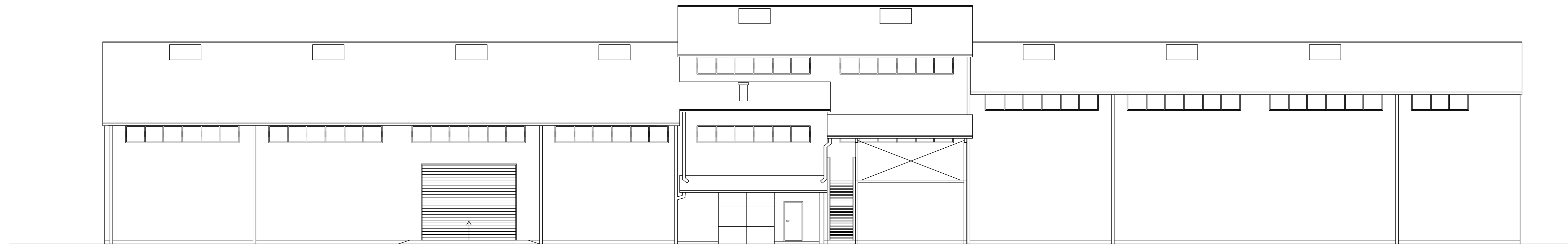
ELEWACJA ZACHODNIA 1:100